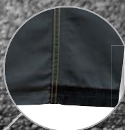
Bajos del pantalón reforzados antisuciedad Baixo das calças reforçadas anti-sujidade