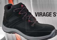
VIRAGE S1P SRC