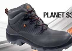
PLANET S3 SRC