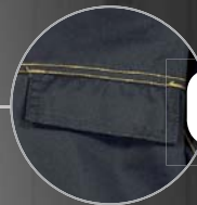
Porta pase identificador Sítio para porta identificação