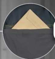
Bolsillo interior Bolso interior