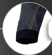
Puños reforzados antisuciedad Punhos reforçados anti-sujidade