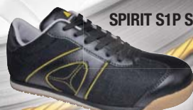
SPIRIT S1P SRC