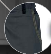
Bolsillos jean Bolso da calça