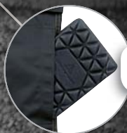
Hueco para rodilleras Bolsa para joelheiras